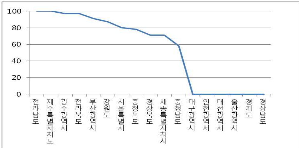
지방자치단체의 웹 개방성 평가 결과 그래프